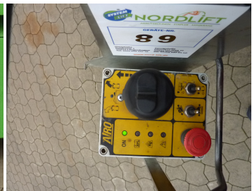
AIRO X10 EN, SF 224038-Korbsteuerung