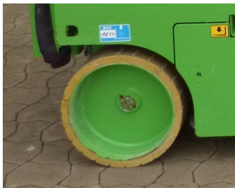
AIRO X10 EN, SF 224038-Helle Reifen