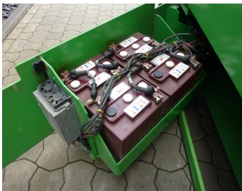
AIRO X10 EN, SF 224038-Batterieantrieb