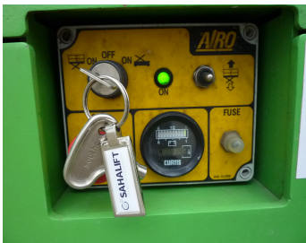
AIRO X10 EN, SF 224038-Bodensteuerung