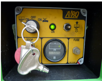
AIRO X12 EN, SF 226653-Bodensteuerung