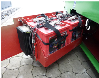
AIRO X12 EN, SF 226653-Batterieantrieb