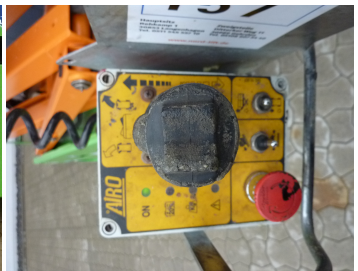
AIRO X12 EN, SF 226653-Korbsteuerung

Produktpdf (Airo AIRO X12 EN (SF226653)) vom 22.03.2023, Seite 2/2