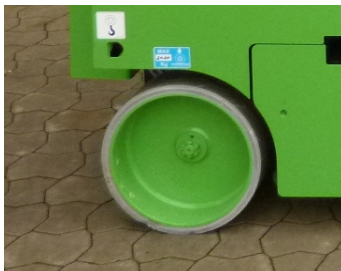
AIRO X12 EN, SF 226653-Helle Reifen