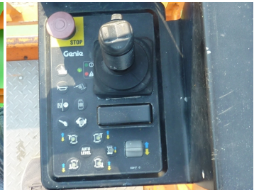
Genie GS 3268 RT, SN 51737-Korbsteuerung