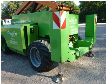
Genie GS 3268 RT, SN 51737-Abstützung