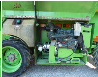
Genie GS 3268 RT, SN 51737-Dieselantrieb