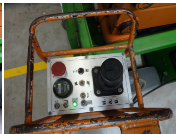
H.A.B. S 175-12 E2WD, SN 220900293-Korbsteuerung

Produktpdf (H.A.B. H.A.B. S 175-12 E2WD, SN 220900293) vom 24.10.2023, Seite 2/2