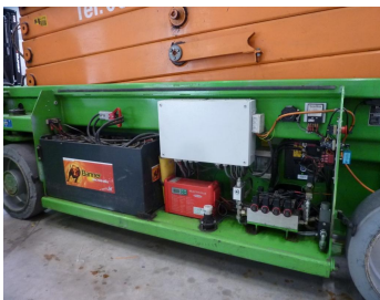
H.A.B. S 175-12 E2WD, SN 220900293-Batterieantrieb