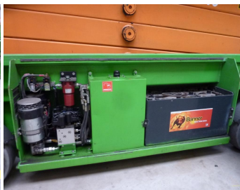
H.A.B. S 175-12 E2WD, SN 220900293-Hydraulikeinheit