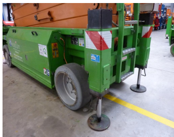
H.A.B. S 175-12 E2WD, SN 220900293-Helle Reifen