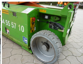
H.A.B. S 66-8-E2WD, SN 221401015-Helle Reifen