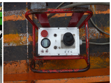
H.A.B. S 66-8-E2WD, SN 221401015-Korbsteuerung

Produktpdf (H.A.B. H.A.B. S 66-8-E2WD, SN 221401015) vom 09.11.2022, Seite 2/2