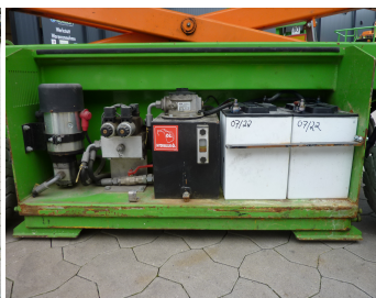
H.A.B. S 66-8-E2WD, SN 221401015-Hydraulik-Modul