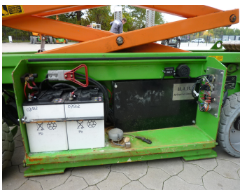
H.A.B. S 66-8-E2WD, SN 221401015-Batterieantrieb