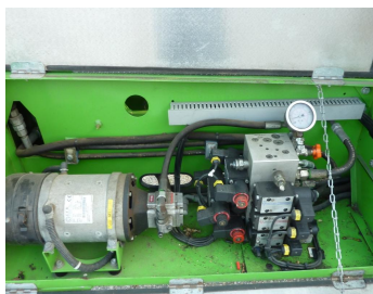
1650 EBZ, 7384 P-Hydraulik