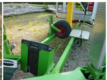
1650 EBZ, 7384 P-Unterlegplatten u. Halterung Rangierrad

Produktpdf (Ommelift Omme 1650 EBZ (7384 P)) vom 03.09.2024, Seite 2/2