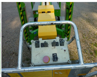
1650 EBZ, 7384 P-Korbsteuerung