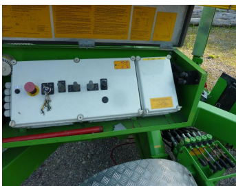
1650 EBZ, 7384 P-Bodensteuerung