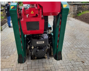
Ruthmann SA26 (Dornseiff)-Benzinmotor