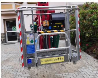
Ruthmann SA26 (Dornseiff)-Drehbarer Arbeitskorb