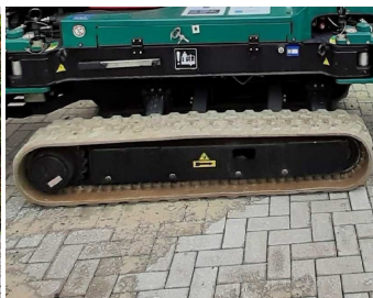
Ruthmann SA26 (Dornseiff)-Helle Raupen