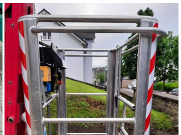
Ruthmann SA26 (Dornseiff)-Korbsteuerung

Produktpdf (Ruthmann Ruthmann SA 26 (im Kundenauftrag)) vom 16.09.2024, Seite 2/2